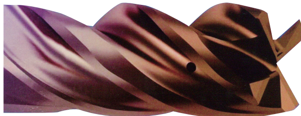
RF 100 diver